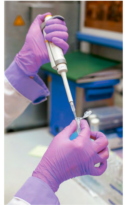
Очистка синтезированных олигонуклеотидов

Подготовила Юлия Позднякова