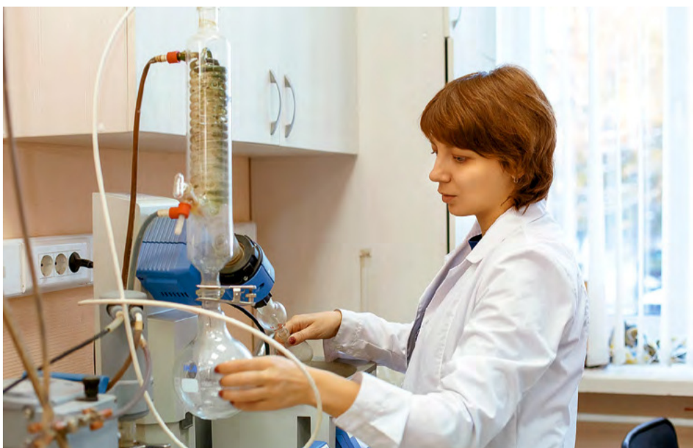
Синтез новых конъюгатов в лаборатории органического синтеза ИХБФМ СО РАН