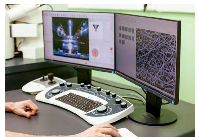
Микроскоп в лаборатории молекулярной медицины ИХБФМ СО РАН