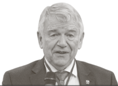
В. Н. Пармон

«Это насущные вопросы для России, на них опирается ее будущее», — подчеркнул, приветствуя участников мероприятия, председатель Сибирского отделения РАН академик Валентин Николаевич Пармон. Он отметил, что в ходе своего визита в Иркутск провел серию рабочих встреч и пообщался с представителями разных направлений наук.