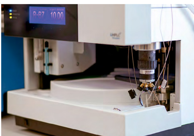
Масс-спектрометрический комплекс в Объединенном центре геномных, протеомных и метаболомных исследований