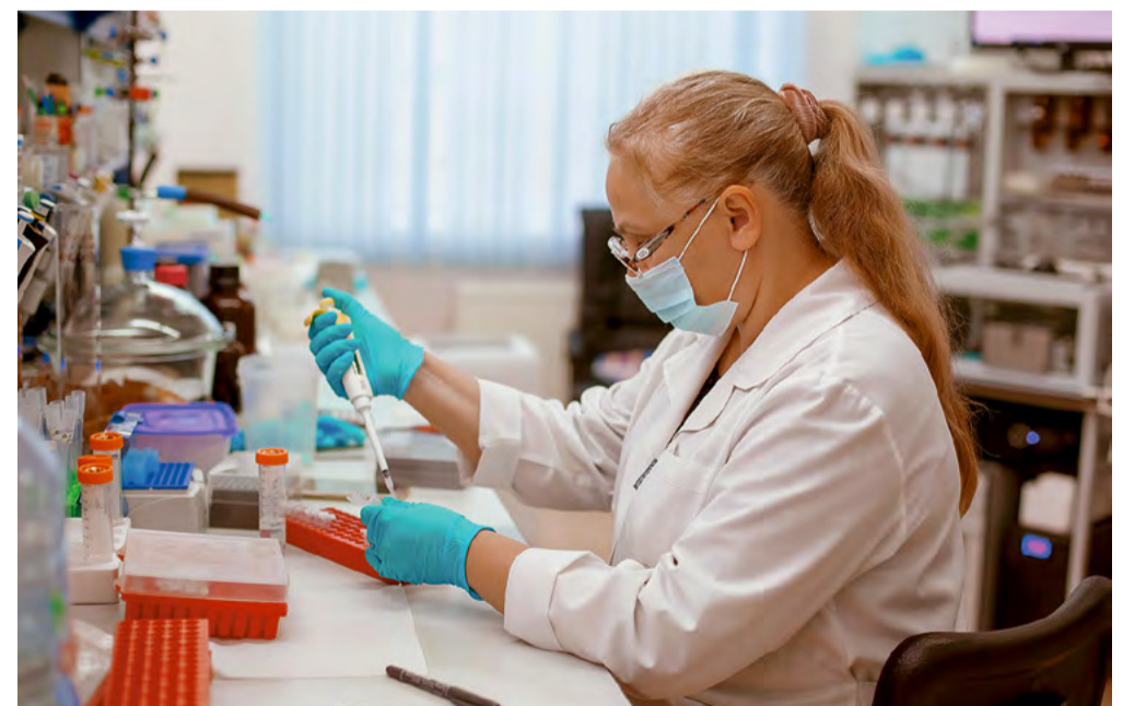
Выделение нуклеиновых кислот в лаборатории синтетической биологии ИХБФМ СО РАН