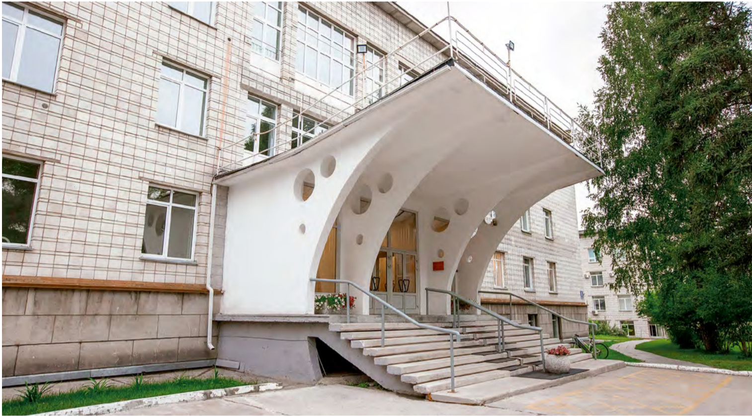
Главный корпус Института химической биологии и фундаментальной медицины СО РАН