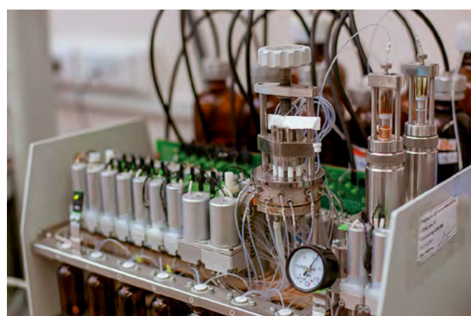
ДНК-синтезатор лаборатории синтетической биологии ИХБФМ СО РАН